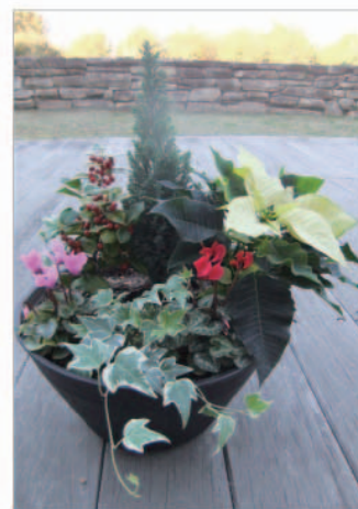
「三方見(後ろが壁になる様な時)の植え方」

病害虫(早期に見つけて退治する、それのための必要な時は、虫には殺虫剤・病気には殺菌剤を散布します。)