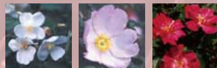
ヤマイバラ サンショウバラ コウシンバラ